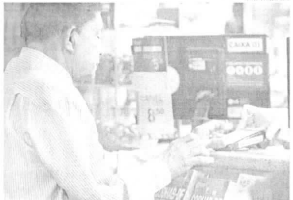
O crédito consignado é um empréstimo que tem desconto direto na aposentadoria ou pensão

Indicador. Em um mês de Programa Deserrola, as empresas ligadas ao Banco do Brasil renegociaram R$ 5,4 bilhões. Desse total, mais de R$ 850 milhões correspondem à Faixa 2 do programa. R$ 4,1 bi dizem respeito às renegociações específicas herdadas pelo próprio banco e R$ 377 milhões foram renegociados por meio da empresa Avios S.A, subsidiária do banco.