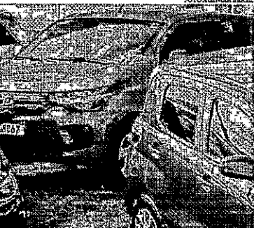
Lista dos modelos organizada por ordem alfabética, com os descontos, pode ser vista no portal do Ministério do Desenvolvimento

A soma de todas as solicitações representa R$ 150 milhões, ou seja, 30% do teto de R$ 500 milhões que poderia ser usado pelas empresas no abatimento de tributos para venda de carros mais baratos. O Ministério disse que, "na medida em que usarem os valores solicitados, as montadoras podem