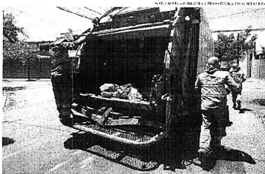
A cobrança sobre a coleta do lixo na cidade começou em abril, após ser aprovada em dezembro

De acordo com a decisão, a acusação de que há uma violação sobre o conceito de taxa parece consistente, pois há ausência da questão da "referibilidade" exigida - o que se refere à cobrança não ser baseada na quantidade de lixo coletado ou ser proporcional ao serviço oferecido, e sim ao tamanho de cada imóvel. "Como a lei municipal não guarda correlação com o contribuinte, há inconstitucionalidade baseada na referencialidade, como descreveu a ADI do MPCE, confirmada por parecer da Procuradoria Geral do